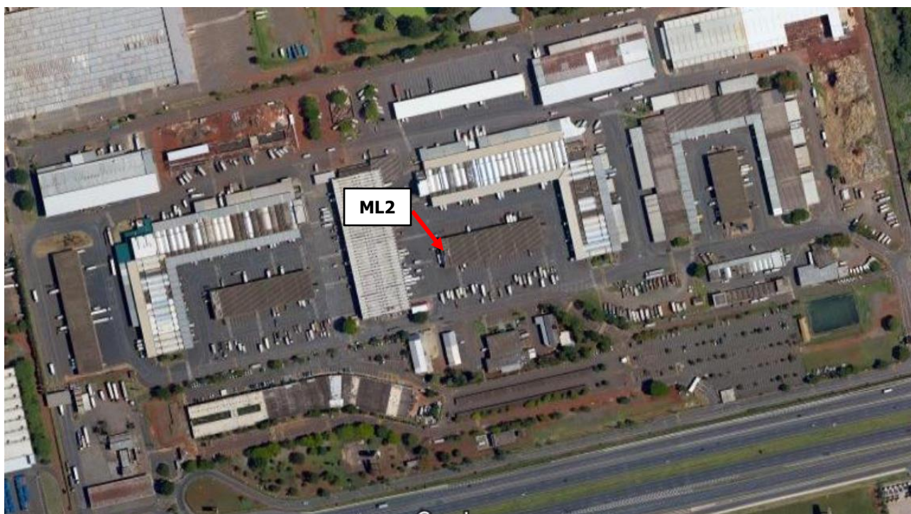
Figura 01 – Situação do ML2 na planta da CEASA Campinas

O presente tem como objetivo a aquisição e instalação de vitrine refrigerada e vitrine estufa para restaurante localizado no prédio anexo ao ML2, no interior da planta da CEASA Campinas – Rodovia Dom Pedro I – km 140,5 – Pista Norte – Barão Geraldo – Campinas/SP.