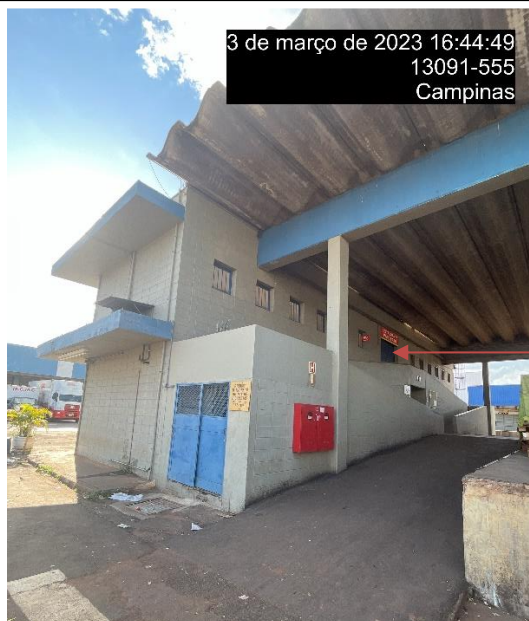
Porta do restaurante