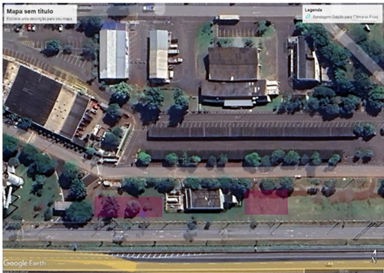
Figura 5 – Área de execução da sondagem