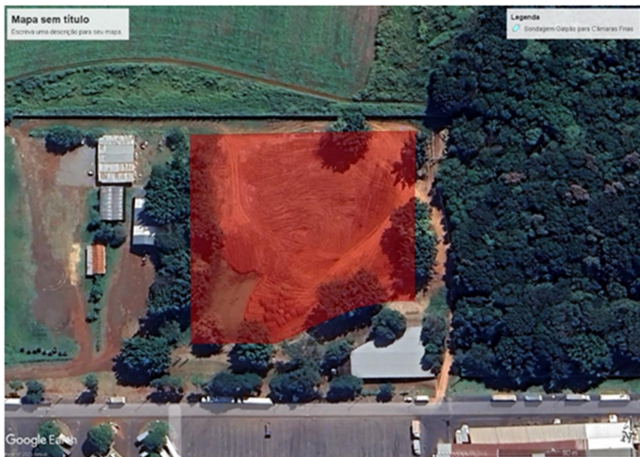
Figura 3 – Área de execução da sondagem