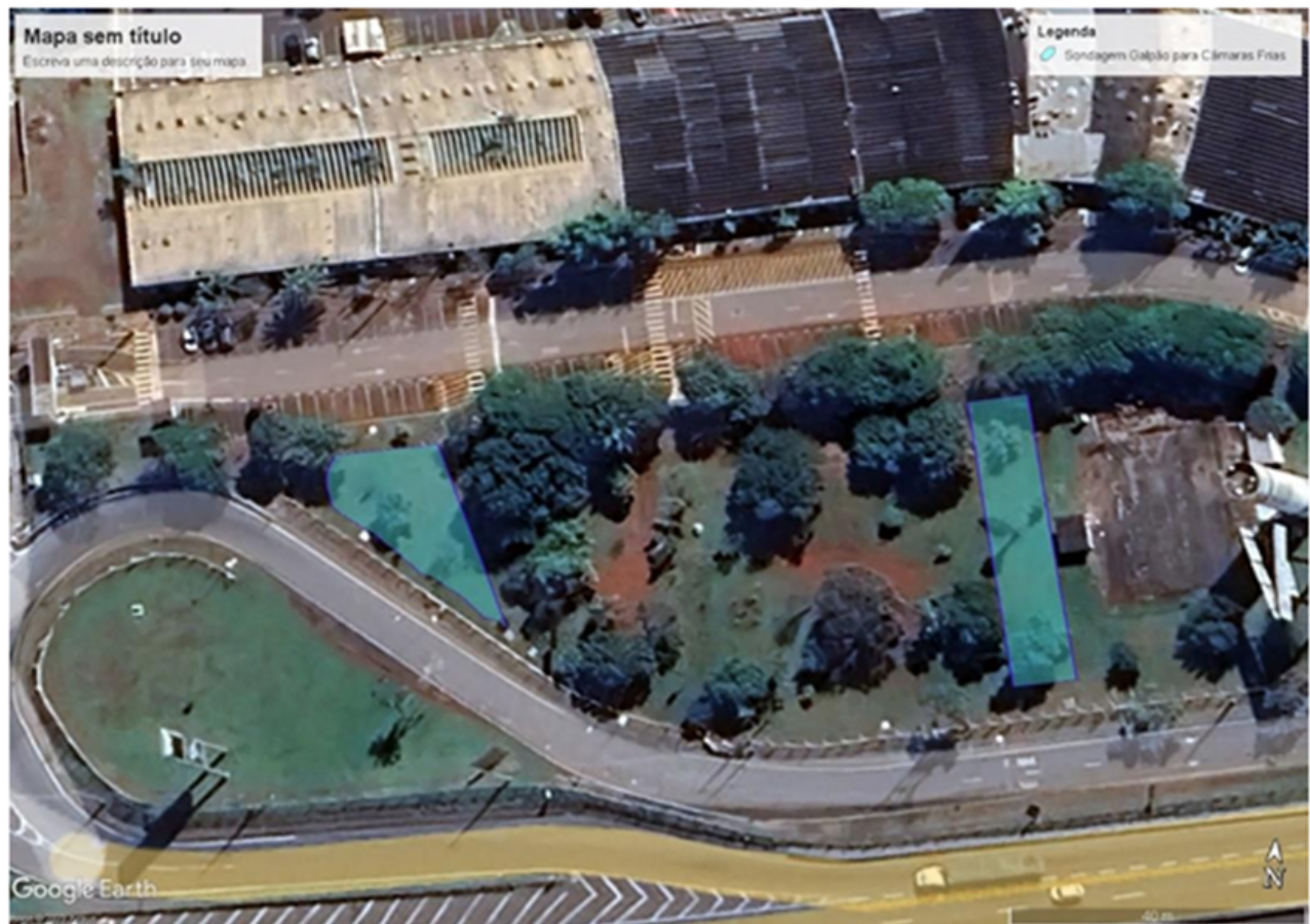
Figura 4 – Área de execução da sondagem