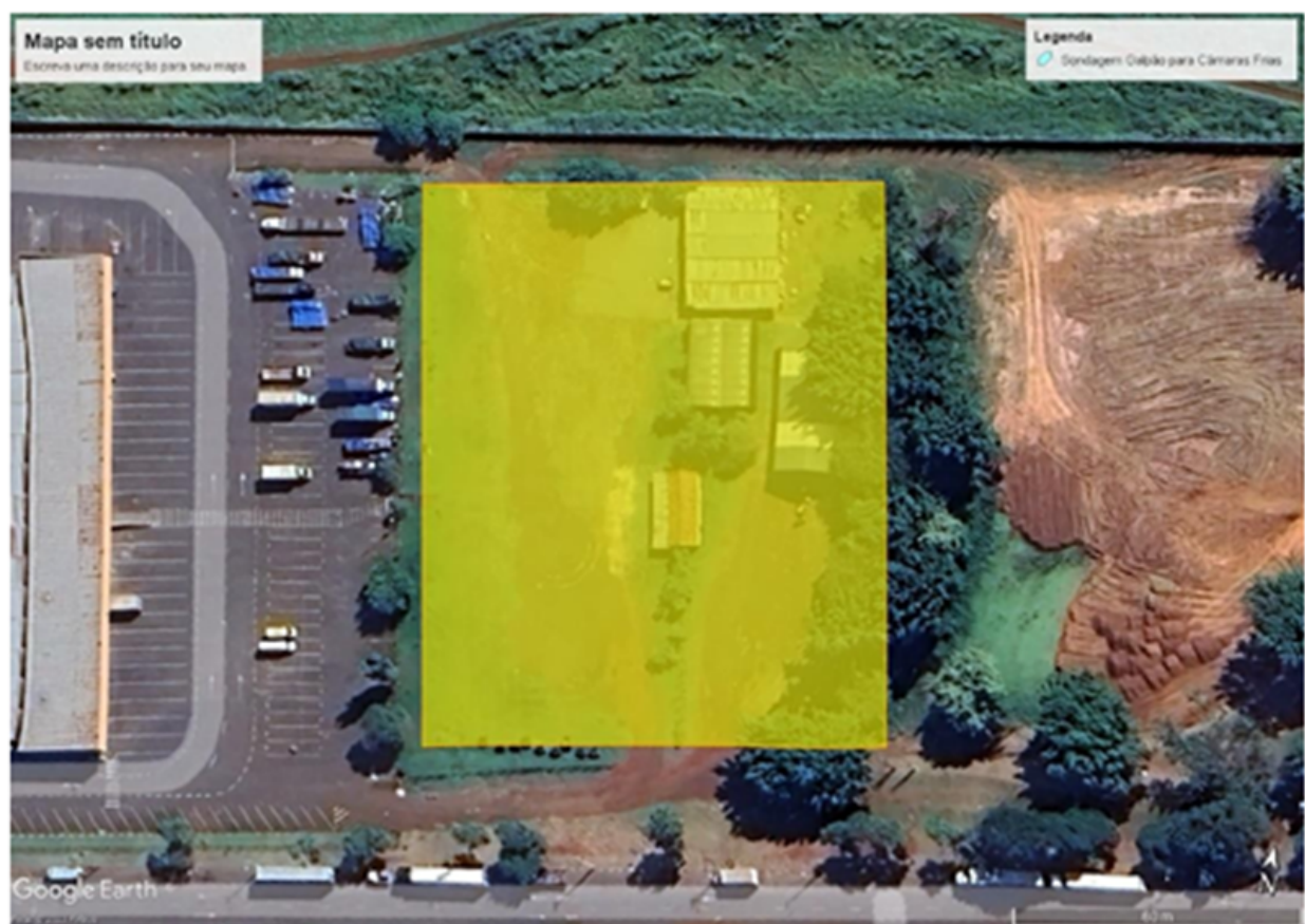
Figura 2 – Área de execução da sondagem