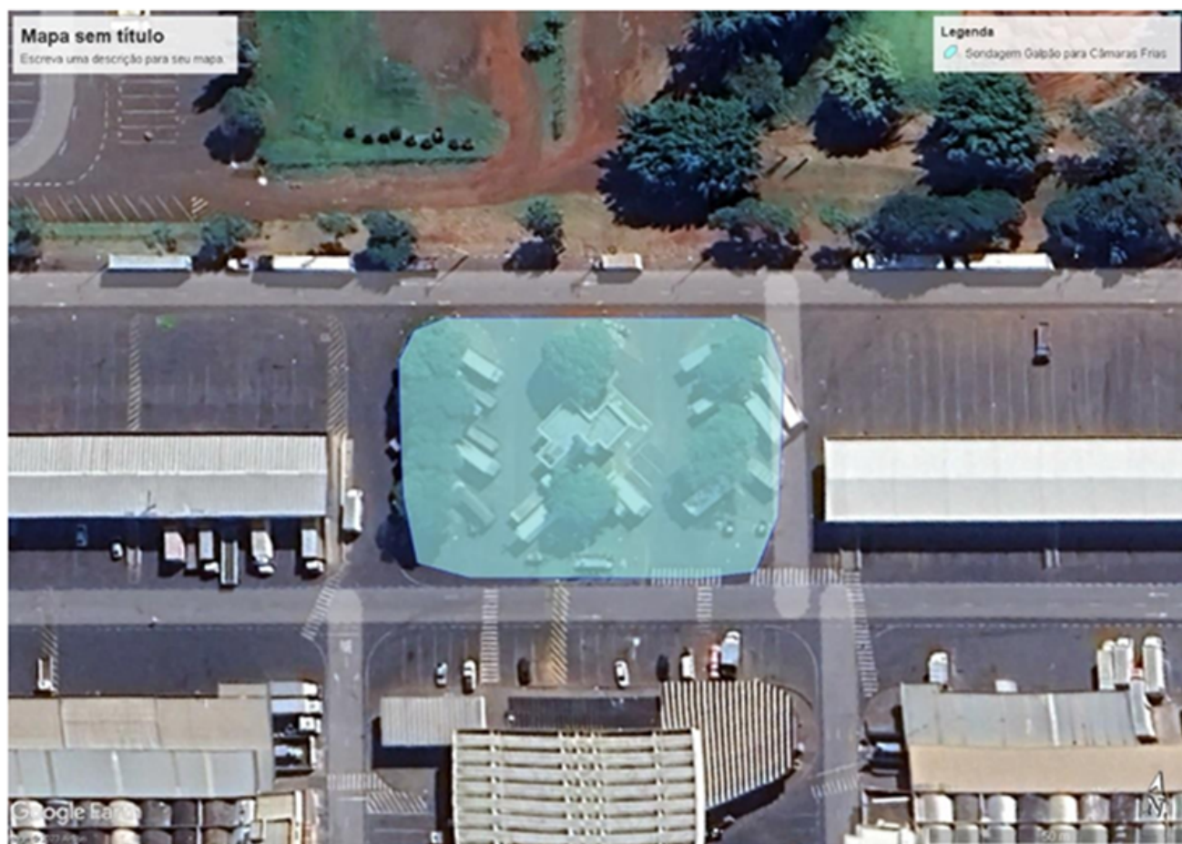
Figura 1 – Área de execução da sondagem